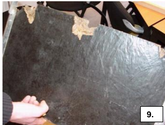
Spaanplaten plaat. Zowel gecoate als ongecoate spaanplaten worden niet geaccepteerd.